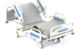
M420-02 Hospital Ward & Nursing Bed เตียงควบคุมด้วยไฟฟ้า 3 โกร์ รองรับน้ำหนัก 250 กก. M420-02 CareTek Electric Bed, Split Side Rail