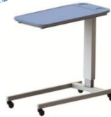
Overbed โต๊ะพร้อมเตียง ปรับความสูงได้ 78-109 ซม. น้ำหนัก 10 กก. รองรับน้ำหนักได้ 45 กก. วัสดุโพลีเมอร์ HT110P CareTek Overbed Table