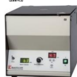
PLC-012E Universal Centrifuge ใช้กับหัวปั่นได้หลายแบบ สวิตช์เบรกไฟฟ้า ความเร็วรอบในการปั่นสูงสุด 12,000 รอบ/นาที, น้ำหนัก 15 กก.