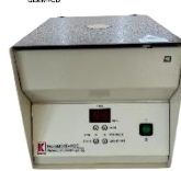
KHT-410E(B) Micro Hematocrit Centrifuge ความเร็วรอบในการปั่นสูงสุด 12,000 รอบ/นาที RCF 14,490 xg, มีระบบเบรกอัตโนมัติ สามารถตั้งเวลาได้, น้ำหนัก 11.5 กก.