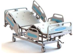
M420-33 Hospital Ward & Nursing Bed เตียงควบคุมด้วยไฟฟ้า 3 โกร์ รองรับน้ำหนัก 250 กก. มีฟังก์ชันการทำ CPR M420-33 CareTek Electric Bed