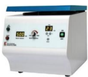
PLC-036H Universal Centrifuge ใช้กับหัวปั่นได้หลายแบบ มีระบบเบรกอัตโนมัติ ความเร็วรอบในการปั่นสูงสุด 15,000 รอบ/นาที, น้ำหนัก 17 กก. (ไม่รวมหัวปั่น)