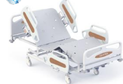
M420-02 Hospital Ward & Nursing Bed เตียงควบคุมด้วยไฟฟ้า 3 โกร์ รองรับน้ำหนัก 250 กก. มีแบตเตอรี่สำรอง M420-02 CareTek Electric Bed, Split Side Rail Bed