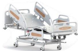
M420-33 Hospital Ward & Nursing Bed เตียงควบคุมด้วยไฟฟ้า 3 โกร์ รองรับน้ำหนัก 250 กก. มีฟังก์ชันการทำ CPR มีแบตเตอรี่สำรอง M420-33 CareTek Electric Bed