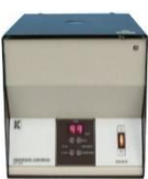
KHT-430B Micro Hematocrit Centrifuge ความเร็วรอบในการปั่นสูงสุด 12,000-13,000 รอบ/นาที RCF 14,490-17,005 xg, ระบบเบรกอัตโนมัติ สามารถบรรจุหลอดคาปิลารีได้ 24 หลอด, น้ำหนัก 16 กก.